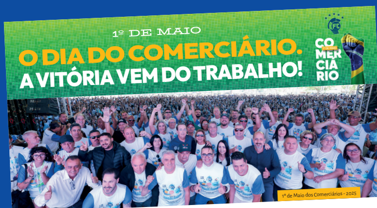
1º de Maio dos Comerciantes - 2025