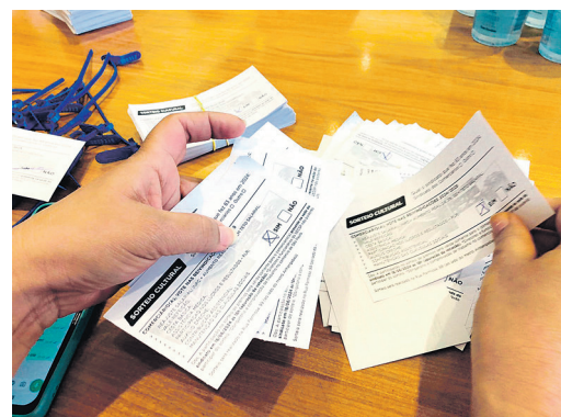
Apuração dos votos e contagem das cédulas