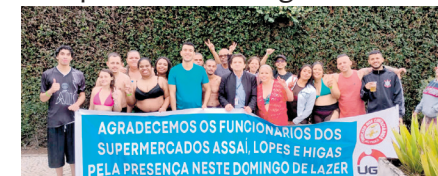
Momento de lazer e descontração promovido pelo Sindicato.

zados pelo Campana Laboratório de Análises Clínicas ou a+ Medicina Diagnóstica, ambos do renomado Grupo Fleury, garantindo qualidade e precisão nos diagnósticos.