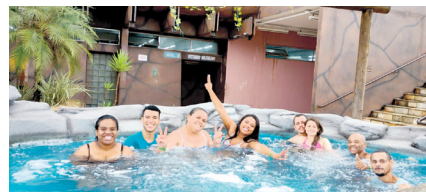
Comerciários (as) relaxando nas águas quentes do Parque Aquático

Apesar do tempo frio, os trabalhadores e as trabalhadoras aproveitaram as piscinas e o evento foi bastante proveitoso. Os participantes puderam conhecer melhor a estrutura do Parque e entender um pouco mais sobre os benefícios que o Sindicato oferece para toda a categoria.