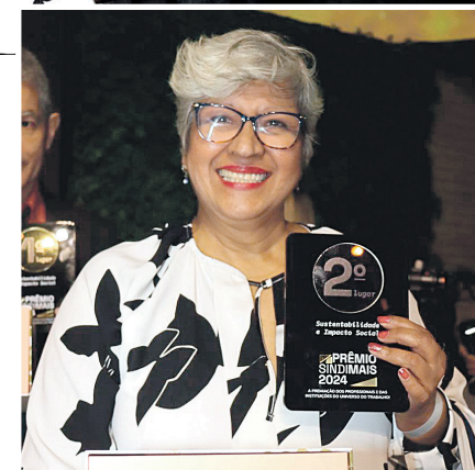
Reconhecimento de Excelência: UGT recebe o prêmio no evento Sindimais pela realização do Mutirão de Emprego, destacando-se pelo compromisso com a geração de oportunidades e inclusão social

sido realizado regularmente desde 2016 no Vale do Anhangabaú, em São Paulo. Este projeto conta também com a colaboração de outros sindicatos, como o Siemaco, o Sindicato dos Padeiros e o Sindicato de Cargas Próprias. O objetivo principal é proporcionar oportunidades reais de emprego e facilitar a recolocação de pessoas no mercado de trabalho, promovendo assim a inclusão social.