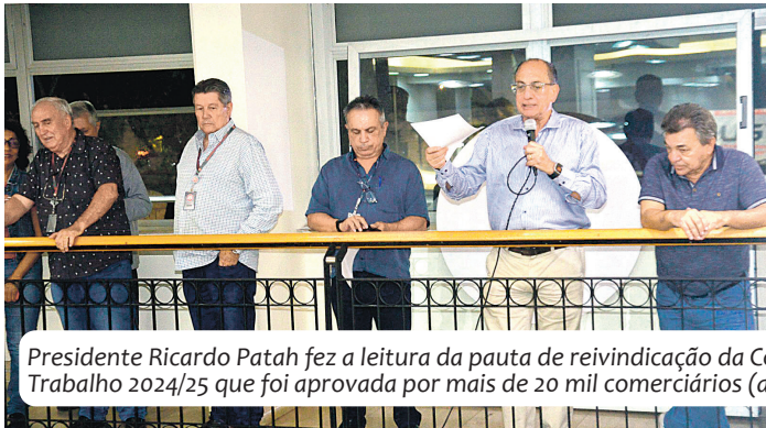
Presidente Ricardo Patah fez a leitura da pauta de reivindicação da Convenção Coletiva de Trabalho 2024/25 que foi aprovada por mais de 20 mil comerciários (as)

Em 18 de junho, a sede do Sindicato dos Comerciários de São Paulo, localizada na região central da cidade, foi palco da assembleia de apuração dos votos referentes à pauta de reivindicação da Convenção Coletiva de Trabalho 2024/2025. O evento marcou o encerramento do processo de votação iniciado há 15 dias e contou com a expressiva participação de aproximadamente 20 mil trabalhadores e trabalhadoras do setor, que demonstraram grande interesse e mobilização em relação às propostas apresentadas.