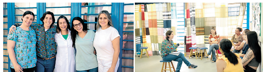
Graças a ação e a dedicação dos (as) voluntários (as), a ponte Brasilitália pode promover um evento voltado ao bem-estar e a saúde da comunidade do Rio Pequeno