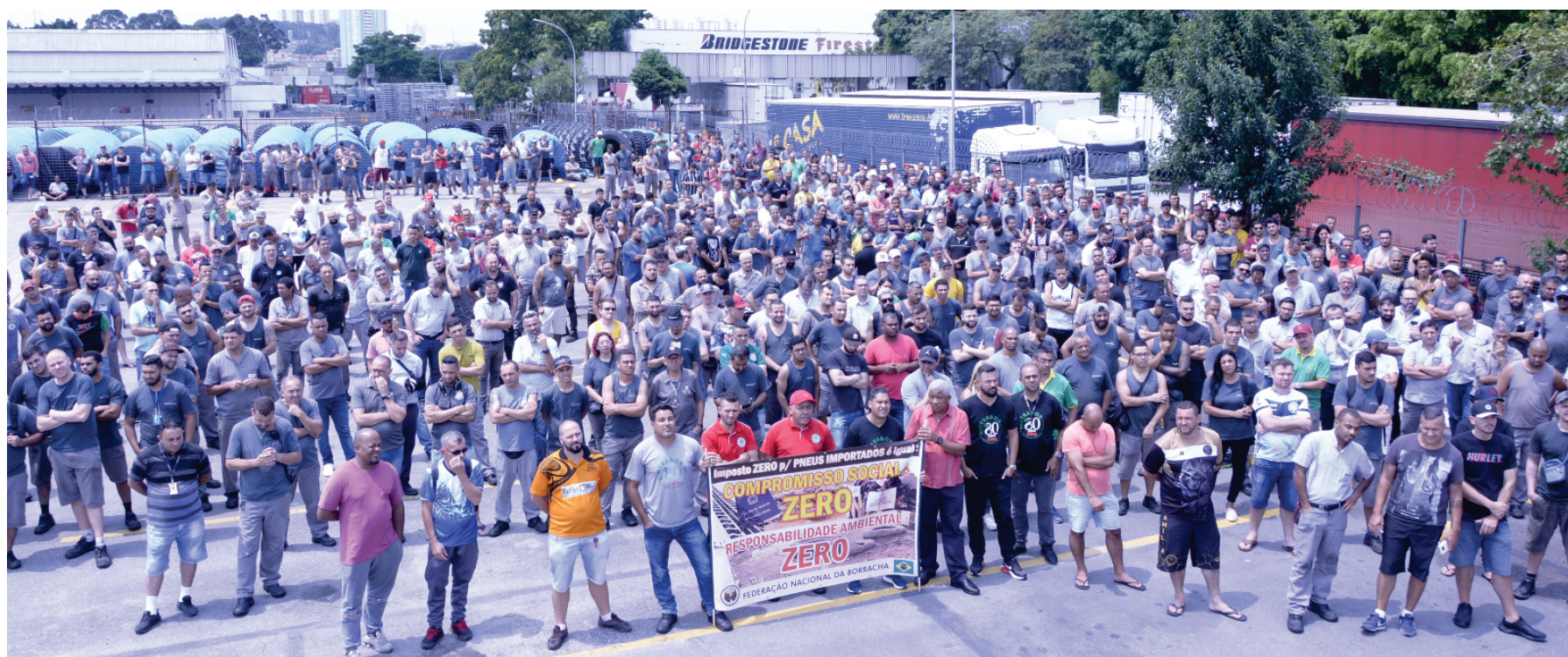
Assembleia na Bridgestone, em 08 de Fevereiro de 2023, para falar aos trabalhadores(as) sobre a questão da revisão do imposto zero para pneus importados no setor de cargas