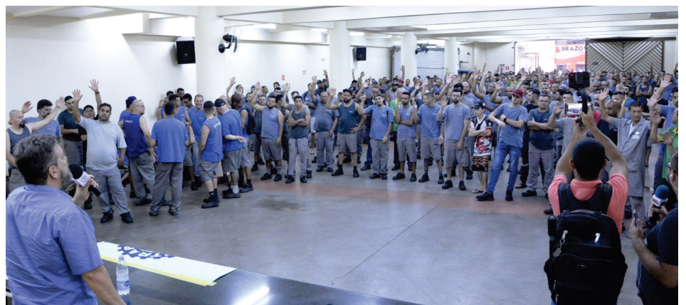
Em função da crise na indústria da borracha, trabalhadores da Bridgestone aprovam Lay Off na Assembleia realizada em 25 de setembro, na subsele do SINTRABOR, em Santo André